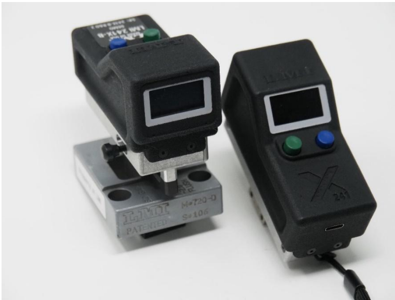
LMI 241X-B e LMI 241X